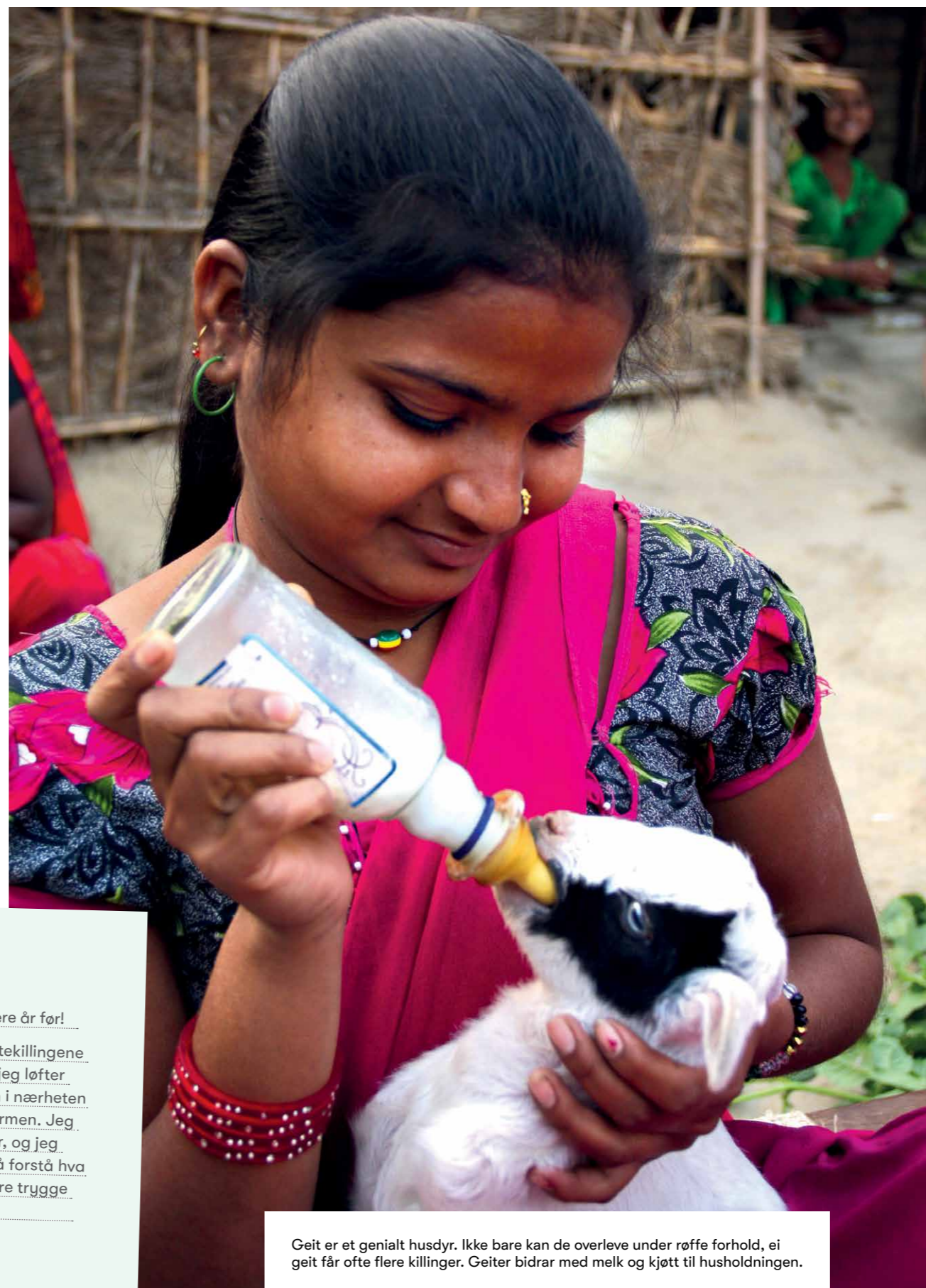
Geit er et genialt husdyr. Ikke bare kan de overleve under røffe forhold, ei geit får ofte flere killinger. Geiter bidrar med melk og kjøtt til husholdningen.