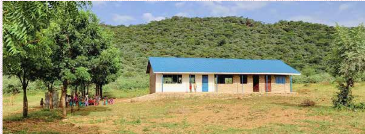
Den nye barnehagen i Kuron i Sør Sudan. Her får nå 170 barn opplæring og kan forberede seg til å begynne på skolen.