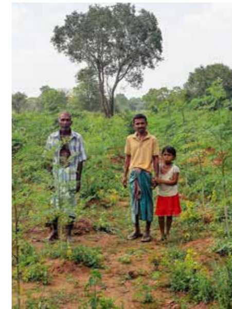
En familie viser stolt frem skogen av pepperrot-trær som skal gi dem ettertraktede pepperoten.

— Først og fremst var det viktig å sikre at dem som hadde mistet alt fikk dekket helt grunnleggende behov, som for eksempel vann både til husbruk og jordbruk. Vi finansierte graving og rensing av brønner. I områder med lite ned-