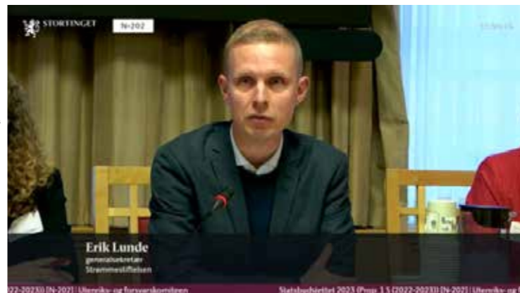
FOTO: SCREEN-SHOT FRA HØYRING I STORTINGET