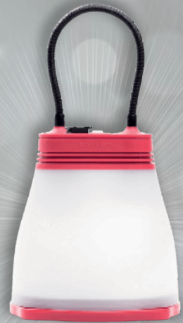
Smart solcellelampe kr. 895,-