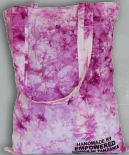
Bonga Bag - Rosa Batikk kr.200,-