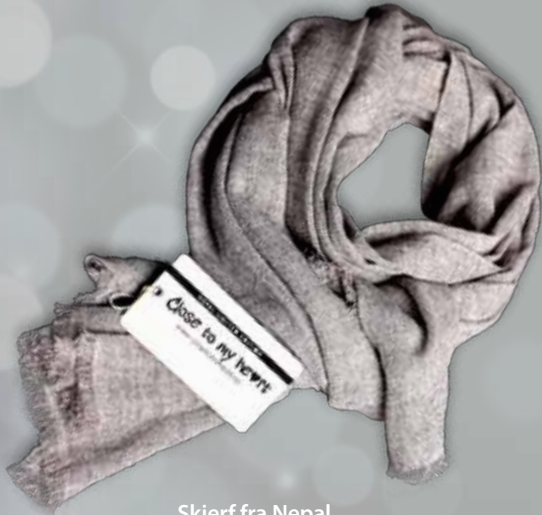
Skjerf fra Nepal kr. 1195,-