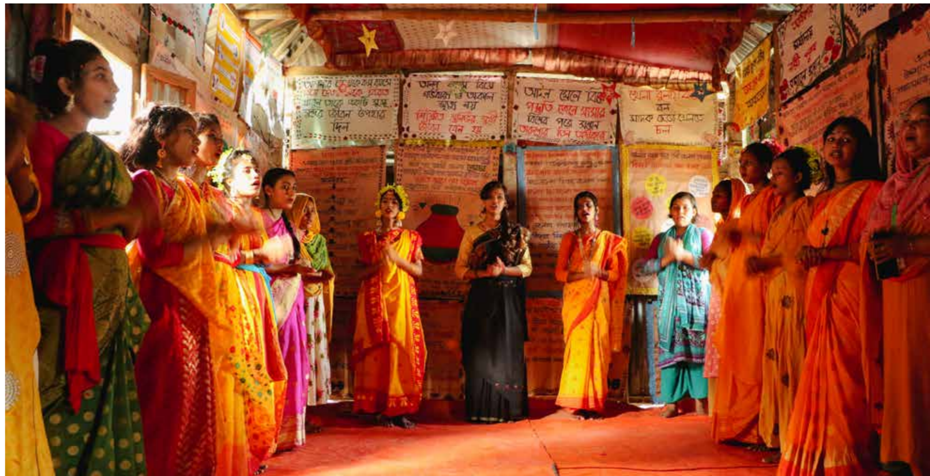
Livsmestringsprogrammet Shonglap skape endringar for jentene og familiene deira i Kurigram. Til nå har dei mellom anna klart å stogge to barneekteskap. Her er jentene saman i eit møte i Shonglap Forum.

sanninga. Men no veit me, og me skal arbeide for å endre samfunnet på dette området, seier dei 18 tenåringsjentene samstemde.