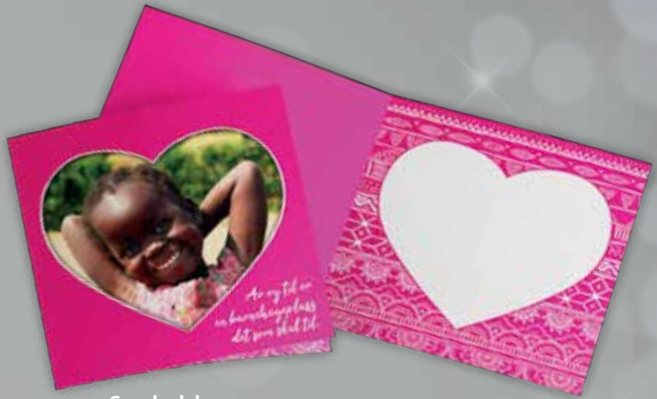
Symbolske gaver fra kr. 100,-