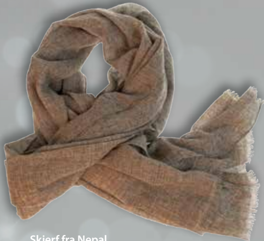
Skjerf fra Nepal kr. 1195,-