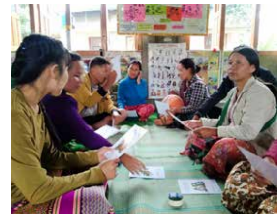
Møte i en av landsbyene vi arbeider i der tema er å bevisstgjøre foreldre på hvor viktig det er å følge opp barna på skolen.