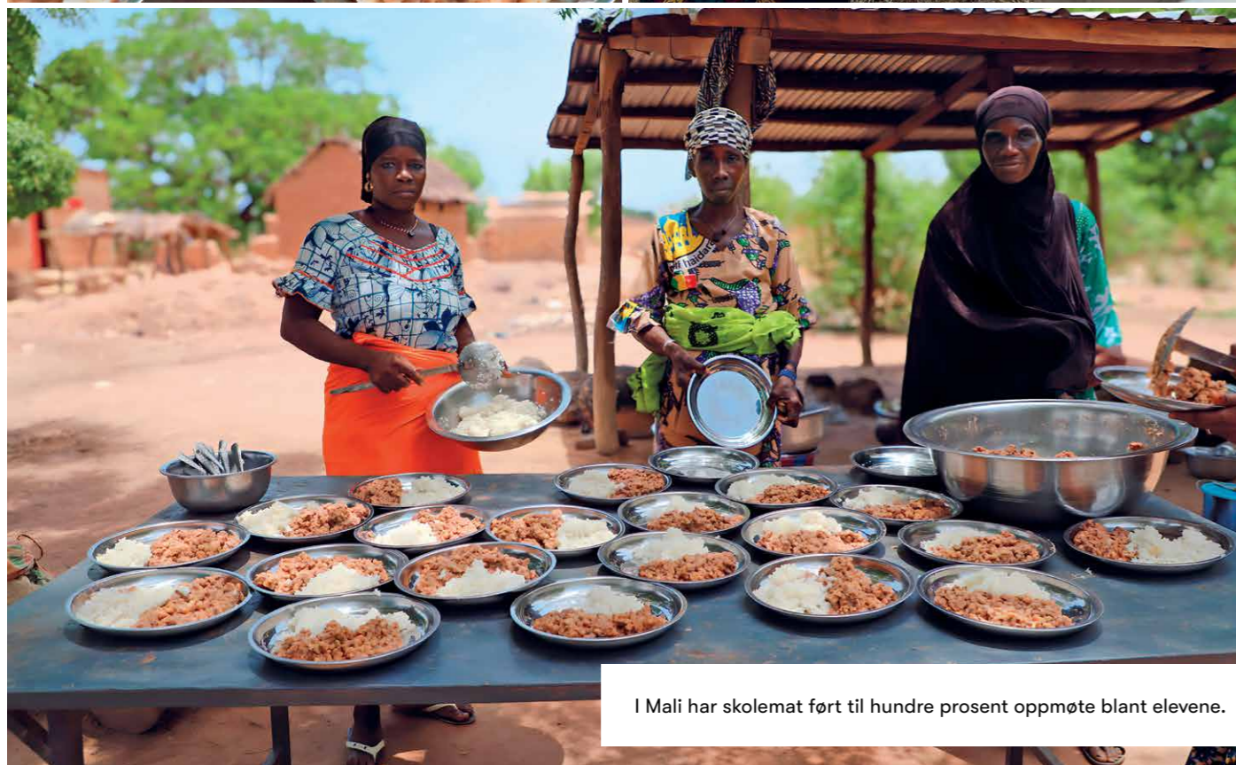
I Mali har skolemat ført til hundre prosent oppmøte blant elevene.

+ opplevde nemlig matmangel i 2021. – Vi vet at om vi klarer å få matsystemene til å fungere mer på kvinners premisser, gir det bedre matsikkerhet for familier og mer økonomisk utvikling, sier utviklingsminister Anne Beathe Tvinneim til Strømmestiftelsen. – Mat er en menneskerett! Mer lokal matproduksjon og mer kunnskap er en nøkkel til at folk vet hvordan de skal skaffe neste måltid og til at småbønder får mer penger i lomma, fortsetter hun. Hun støtter seg blant annet på forskning som har vist at kvinner i større grad enn menn bruker inntekten til det bedre for hele familien.