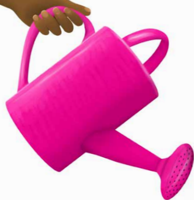
Det nytter! Menneske for menneske, familie for familie, landby for landsby!