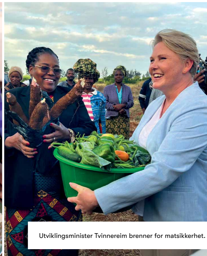
Utviklingsminister Tvinneim brenner for matsikkerhet.