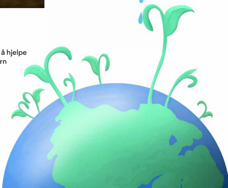
ILLUSTRASJON: GEIR OVE PEDERSEN

EN AV MØDRENE fra selvhjelpsgruppene våre i Haluaghat Sadar, Mymensingh i Bangladesh har også noe å si om at det nytter: «Før jeg ble med i gruppa hadde jeg toppen to daglige måltider mat til hvert av barna mine. Nå har jeg lært å dyrke og å ta vare på maten. Når barna spør om mat, kan jeg gi dem det! Jeg har grønnsaker, egg og kjøtt fra kyllinger. Jeg kan til og med sende med dem nistemat på skolen!»