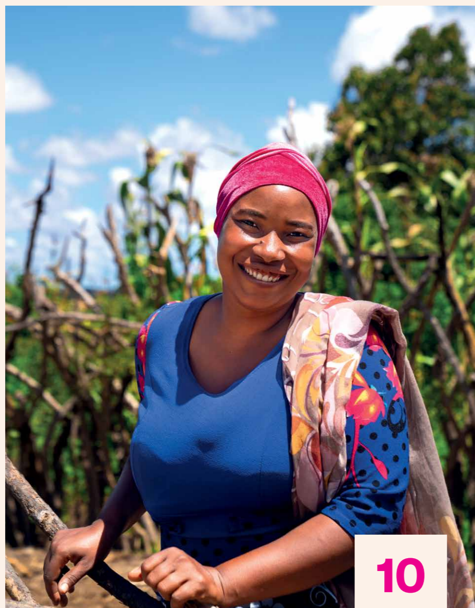
MAT NOK. Sulten i verden øker, og vil sannsynligvis fortsette å gjøre det. Men med enkle og miljøvennlige grep kan gode ting skje!